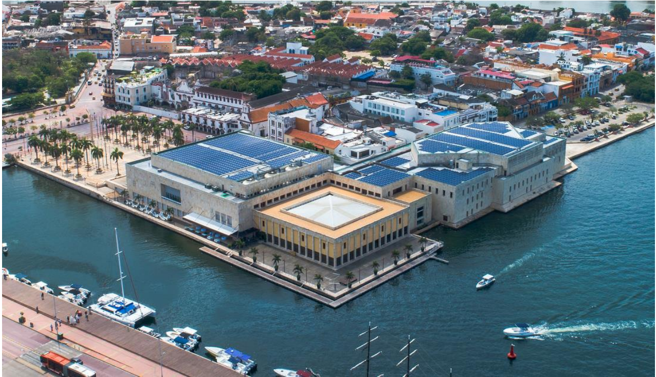
Figura 2. Pasarela flotante del Centro de Convenciones de Cartagena de Indias.