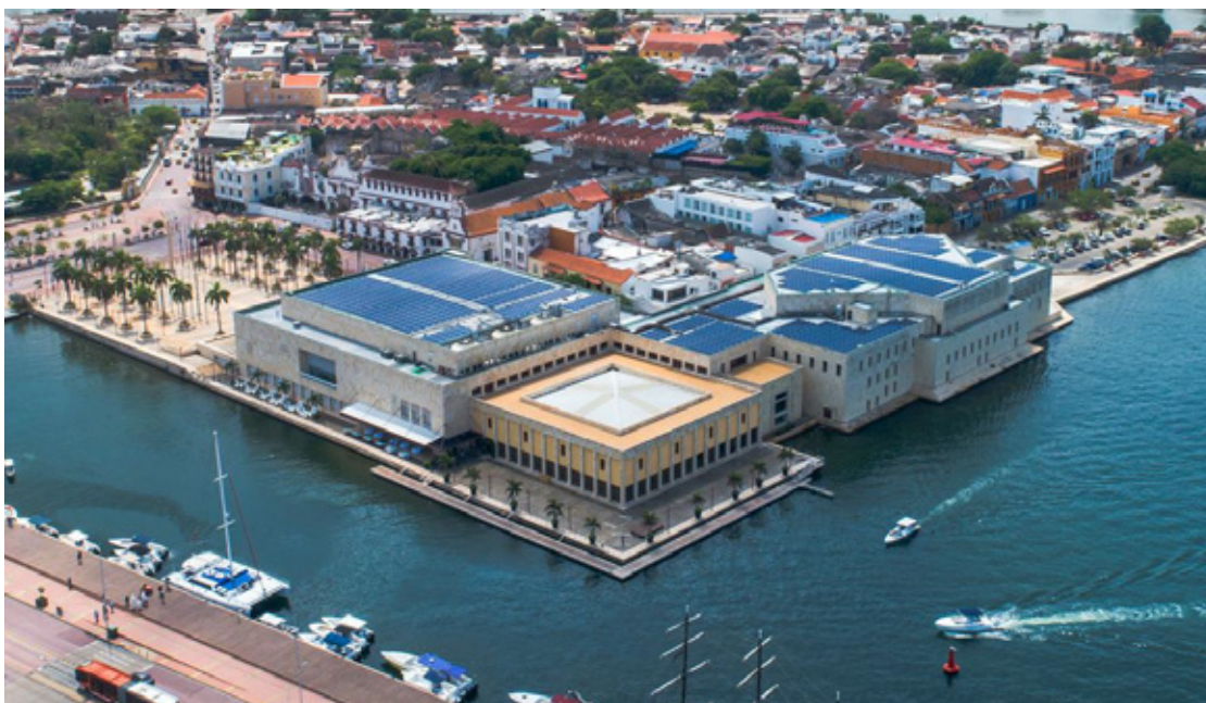
Figura 2. Pasarela flotante del Centro de Convenciones de Cartagena de Indias.